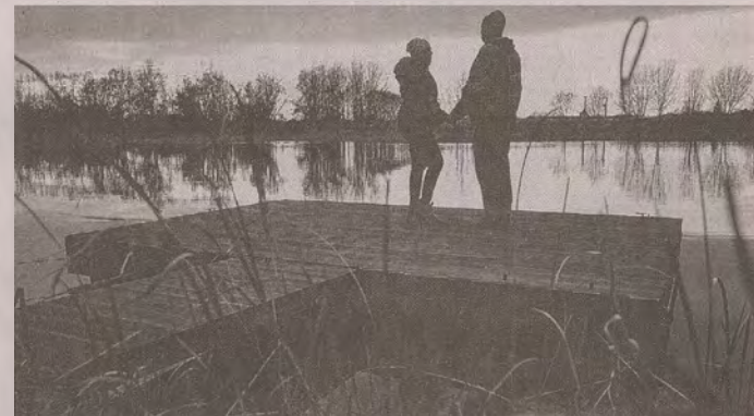
Romantikus séták helyszínének is kiváló a park