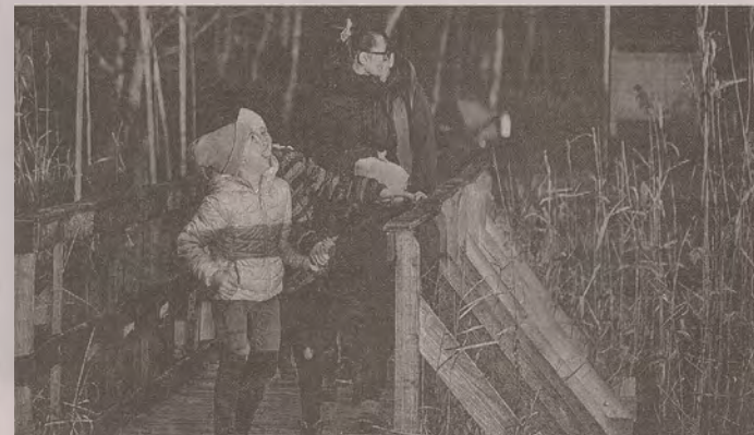
Sok család látogatott ki az elmúlt hétvégén az élményparkba